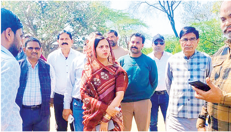
कार्य हर हाल में पूर्ण कर लिया जाए।

अध्यक्ष ने वार्ड संख्या 5 (झांसीपुरा) और वार्ड संख्या 11 (सिविल लाइन तृतीय) का भ्रमण किया। झांसीपुरा में माता मंदिर के पास सफाई व्यवस्था दुरुस्त करने के निर्देश दिए। निरीक्षण के दौरान मोती मंदिर मार्ग पर जल निगम द्वारा डाली जा रही पाइप लाइन के कारण सड़क पर बड़े-बड़े गड्ढे मिले। मोहल्लेवासियों ने शिकायत की कि कई दिनों से गड्ढे न भरे जाने के कारण आवागमन बाधित है और पेयजल की भारी किल्लत है। इस पर अध्यक्ष ने प्रतीक्षालय में पंखे नहीं हैं और शौचालय की स्थिति बेहद खराब है। मौके पर अध्यक्ष ने प्रतीक्षालय में तत्काल नए पंखे और लाइट लगवाने के निर्देश दिए। साथ ही, बस स्टैंड पर स्थित प्याऊ में गंदगी देख उन्होंने सफाई निरीक्षक को