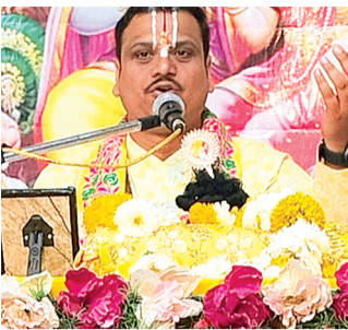
हरिभूमि न्यूज बीना