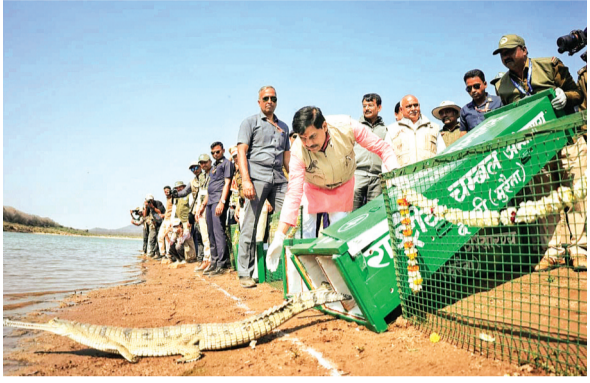
घड़ियाल प्रोजेक्ट के लिए मुफ्रीद है कूनो

प्रोजेक्ट चीता के माध्यम से देश भर में प्रसिद्ध पाने वाले कूनो नेशनल पार्क में अब पर्यटक मारामच्छ, घड़ियाल, कछुए और कई दुर्लभ प्रजाति के जलचरों के दर्शन भी कर सकेंगे। कूनो पर्यटकों का भरपूर मनोरंजन करे इसमें कोई कसर बाकी नहीं छोड़ेंगे। यह बात रविवार को मुख्यमंत्री डॉ मोहन यादव ने कूनो नेशनल पार्क में पत्रकारों के सवाल के जवाब देते हुए कही, वे रविवार को कूनो नदी में घड़ियाल और कछुओं को छोड़ने पहुंचे थे।