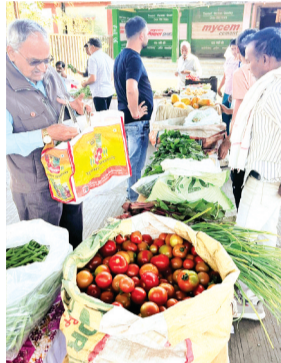
हरिभूमि न्यूज बीना

तहसील में जैविक एवं प्राकृतिक खेती को बढ़ावा देने के उद्देश्य से आयोजित जैविक, प्राकृतिक हाट बाजार का 15 वां सप्ताह रविवार को सफलतापूर्वक संपन्न हुआ। इस हाट बाजार में विकासखंड के जैविक एवं प्राकृतिक खेती करने वाले किसानों ने अपनी उपज की दुकानें लगाईं। गौरतलब है कि आयोजित जैविक, प्राकृतिक हाट बाजार में किसानों द्वारा बैंगन, आलू, चुकंदर, बीस, मेथी, गाजर, पपीता, प्याज, मटर, अमरूद सहित विभिन्न प्रकार की फल एवं सब्जियां प्रचुर मात्रा में बेची गईं। इस पहल से किसानों को उनकी उपज के अच्छे दाम मिल रहे हैं, वहीं नागरवासियों को ताजी एवं गुणवत्तापूर्ण सब्जियां उपलब्ध हो रही हैं। हाट बाजार कृषि उपज मंडी प्रांगण में प्रत्येक रविवार सुबह 9 बजे से आयोजित किया जाता है। बाजार में किसानों की उपज कुछ ही घंटों में बिक जाती है, जिससे किसानों की आय में वृद्धि हो रही है तथा नागरवासियों के स्वास्थ्य में भी सकारात्मक सुधार देखा जा रहा है।